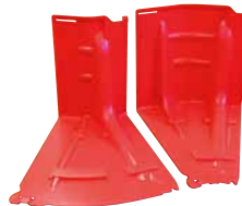
アウトコーナー(左) インコーナー(右)▶