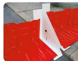
▲段差対応アタッチメント