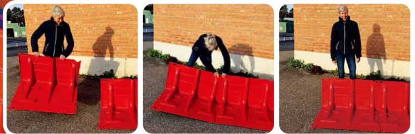
▲設置は、ボックスウォールを背後から見て左から右に並べる

Boxwallは特殊な工具やスキルを必要とせずに設置ができ、ユニットのジョイント部(▼印)をつなぐことができます。各ジョイント部は±3度の調節ができ、カーブした設置場所でも対応可能です。