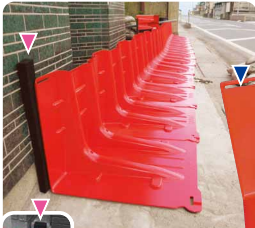
ボックスウォールの背後に壁がある場合はシーリング材を使用