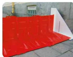
▲サイドアタッチメント